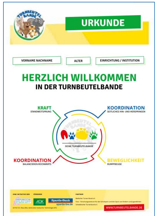
Abb. 4: Urkunde der Turnbeutelbande

Im Nachgang erhält jedes Kinder eine persönliche Urkunde sowie einen Turnbeutel . Damit sind sie nun Teil der Turnbeutelbande.