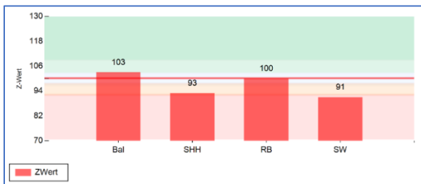
Abb. 3: Leistungsprofil